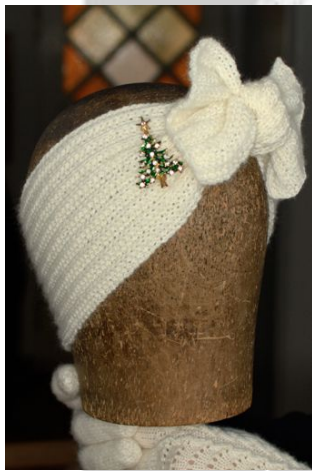
Figur 2 Turban bundet med sløjfe, bemærk hvor skarpt enderne står

Du kan binde en sløjfe ved at slå en knude eller du kan lade enderne krydse hinanden henover panden og så stikke enderne ind. Vælger du at binde en sløjfe, syntes jeg det er pænere, at knuden er så flad som muligt.