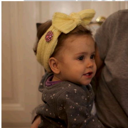
Figur 3 Turban bundet med sløjfe, her står enderne skarpt

Du kan binde en sløjfe ved at slå en knude eller du kan lade enderne krydse hinanden henover panden og så stikke enderne ind. Vælger du at binde en sløjfe, hvilket nok er bedst til helt små børn, syntes jeg det er pæneste, at knuden er så flad som muligt.