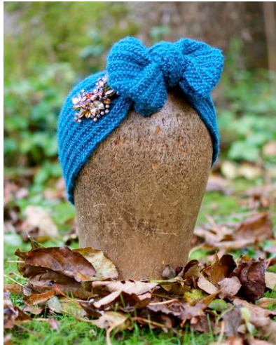
Figur 2 Turban hvor enderne er bukket om og syet fast